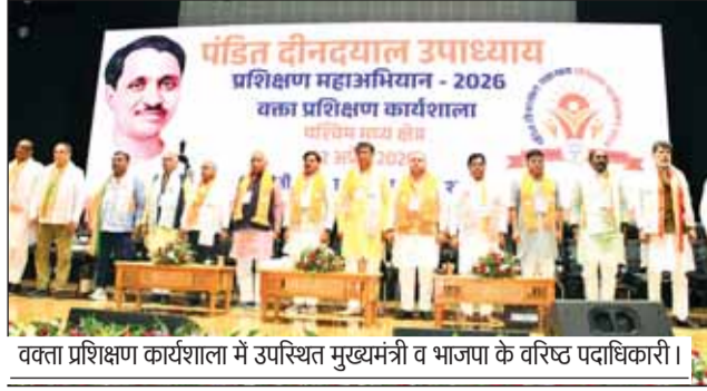
वक्ता प्रशिक्षण कार्यशाला में उपस्थित मुख्यमंत्री व भाजपा के वरिष्ठ पदाधिकारी।

कार्यकर्ताओं की नेतृत्व क्षमता को उभारने का प्रयास