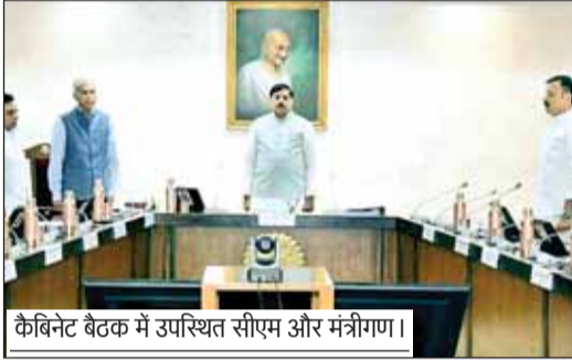
कैबिनेट बैठक में उपस्थित सीएम और मंत्रीगण।